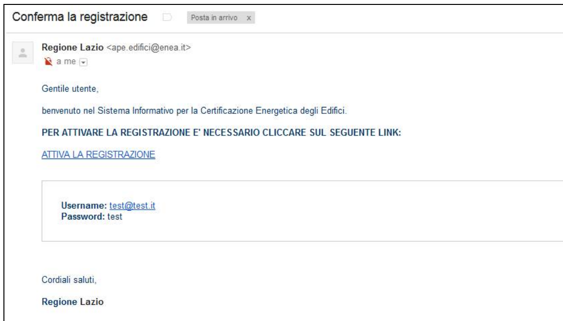
Figura 11 - Email per conferma registrazione

Successivi controlli sulla documentazione autocertificata saranno effettuati a cura degli organi preposti alla gestione del sistema.