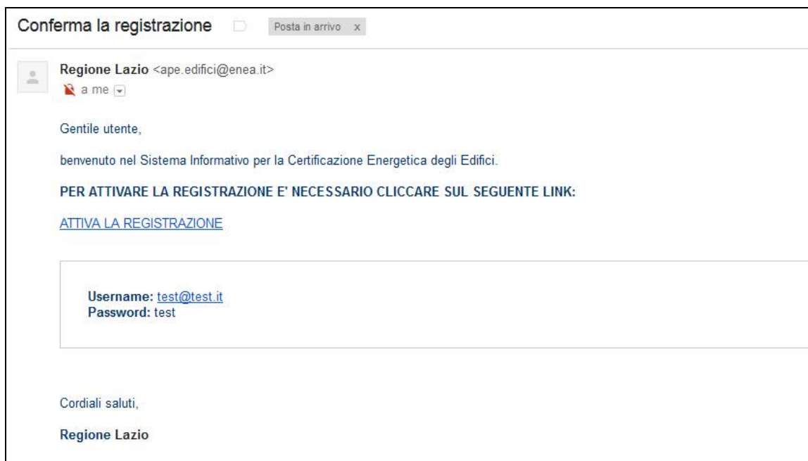
Figura 9 - Email per conferma registrazione

Il soggetto in possesso di password potrà accedere al sistema, specificando come nome utente il proprio indirizzo di posta elettronica, e la password comunicata dal sistema, tramite mail. Dopo il primo accesso, la password potrà essere cambiata dall'utente con una nuova a proprio piacimento.