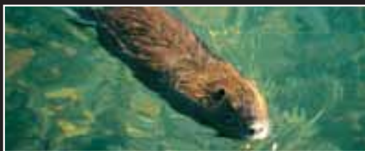
Nutria ( Myocastor coypus ).