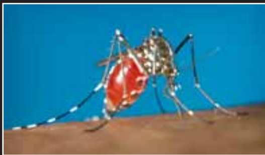
Zanzara tigre ( Aedes albopictus ).

Le cause che sottendono alle introduzioni sono legate soprattutto al commercio internazionale e, come caso particolare, al turismo. Evidentemente le origini di questo fenomeno risalgono alla preistoria, quando gli uomini cominciarono a spostare, intenzionalmente o meno, piante e animali in ogni parte del globo. Considerando la lunga storia della nostra regione, dunque, non stupisce il fatto che il numero di specie non indigene insediatesi con successo nel Lazio sia tanto elevato. Infatti si tratterebbe di una sessantina di specie vegetali (tra cui la robinia e l'ailanto) e di un numero indefinito di animali naturalizzati, peraltro in costante aumento. Alcune specie di mammiferi, come il topolino domestico, il ratto nero, il surmolotto e la nutria sono ormai diffusi su tutto il territorio. Anche tra gli uccelli si annoverano specie ben diffuse, come il fagiano. Sono invece più localizzate le popolazioni di vari mammiferi, come il tamia striato, il dai-