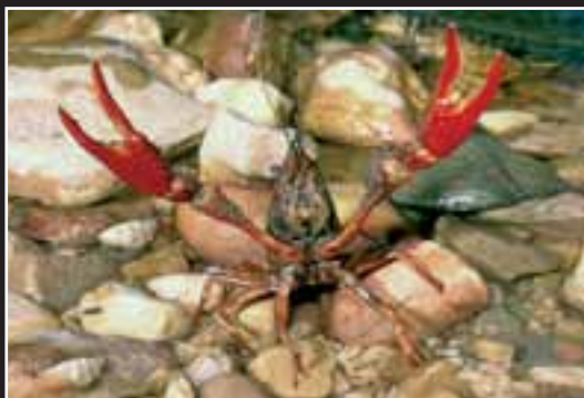
Gambero rosso della Louisiana ( Procambarus clarkii ).

no, il muflone, il coniglio selvatico e il visone americano, nonché di numerosi uccelli, tra cui il parrocchetto dal collare, il pappagallo monaco, il bengalino comune, la maina comune e il francolino di Erckel. Tra i rettili spicca la presenza della testuggine dalle guance rosse, una specie nordamericana la cui diffusione sembra minacciare la rara testuggine palustre europea. Ma sono i pesci e gli invertebrati che contano il maggior numero di specie introdotte. Gli insetti, in particolare, sono protagonisti di vere e proprie invasioni. Basti pensare alla zanzara tigre, originaria dell'Asia, o la Cacyreus