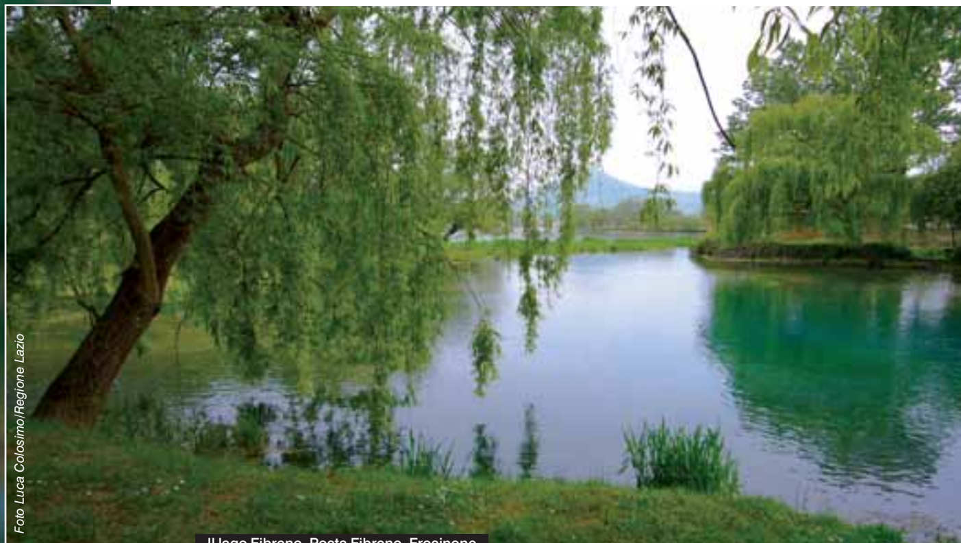
Il lago Fibreno. Posta Fibreno, Frosinone

Vivere nel Lazio per un naturalista, ma anche per i suoi abitanti, è una vera fortuna. Su una superficie di oltre 1.700.000 ettari coperti, solo il 20 per cento è costituito da aree pianeggianti, che hanno visto, nel corso del tempo, la maggiore pressione della presenza dell'uomo. Il resto è composto da colline e montagne di varia origine geologica e diverso aspetto che terminano verso il mare con trecento chilometri di coste basse e sabbiose o alte e rocciose. Una varietà di ambienti che permette di passare, nel corso della stessa giornata, dal Mediterraneo alle vette di alte montagne dove ancora resistono una flora e una fauna caratteristiche di ambienti dell'estremo nord dell'Europa. Questa condizione di estrema varietà geologica, orografica e climatica fa del Lazio una regione ricchissima di biodiversità dove animali e piante delle montagne alpine si trovano a poche decine di chilometri da quelle degli ambienti mediterranei caldi dell'Italia meridionale.