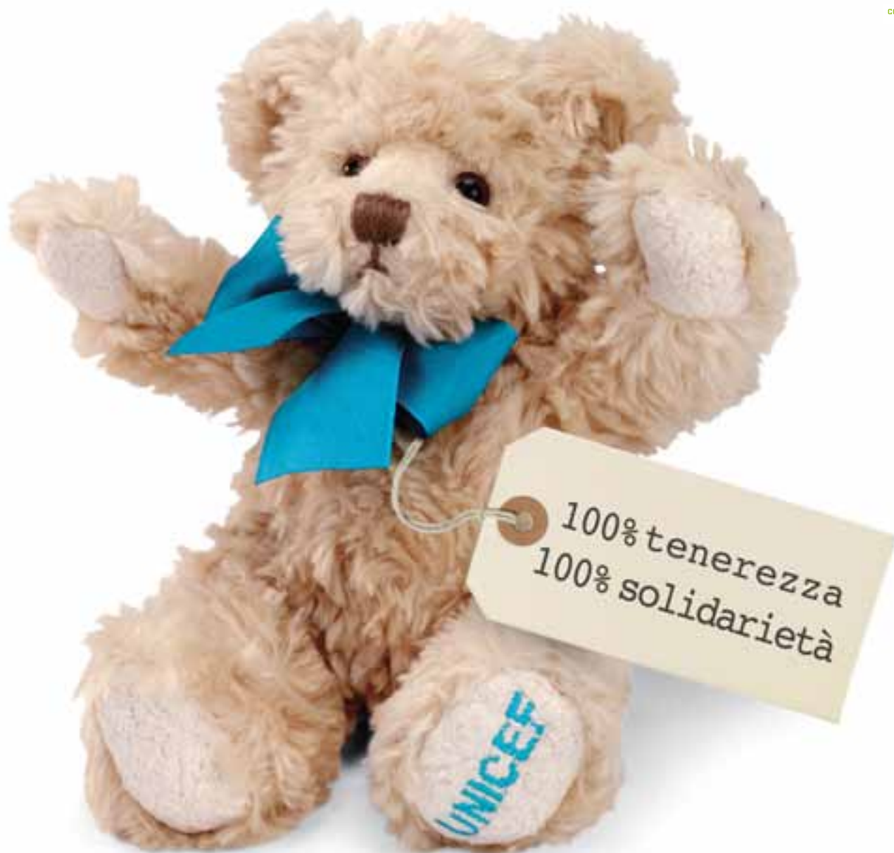
Orsetto Teddy, altezza 18 cm. Dal catalogo Prodotti UNICEF 2007.