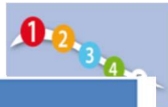
TABELLA 3 - PARAMETRI VITALI PER ATTRIBUZIONE CODICE DI PRIORITA'