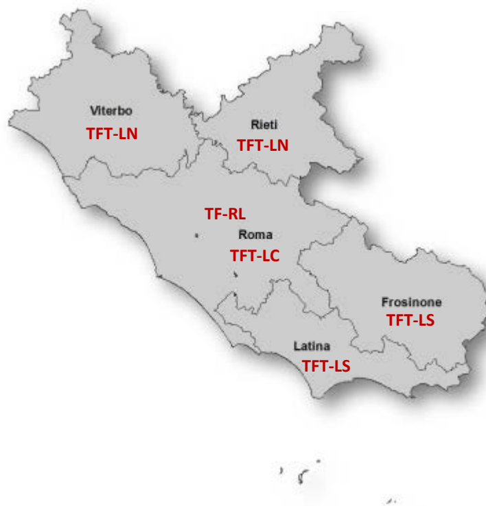
Figura 1. Distribuzione territoriale delle Task Force Multi-Disciplinari