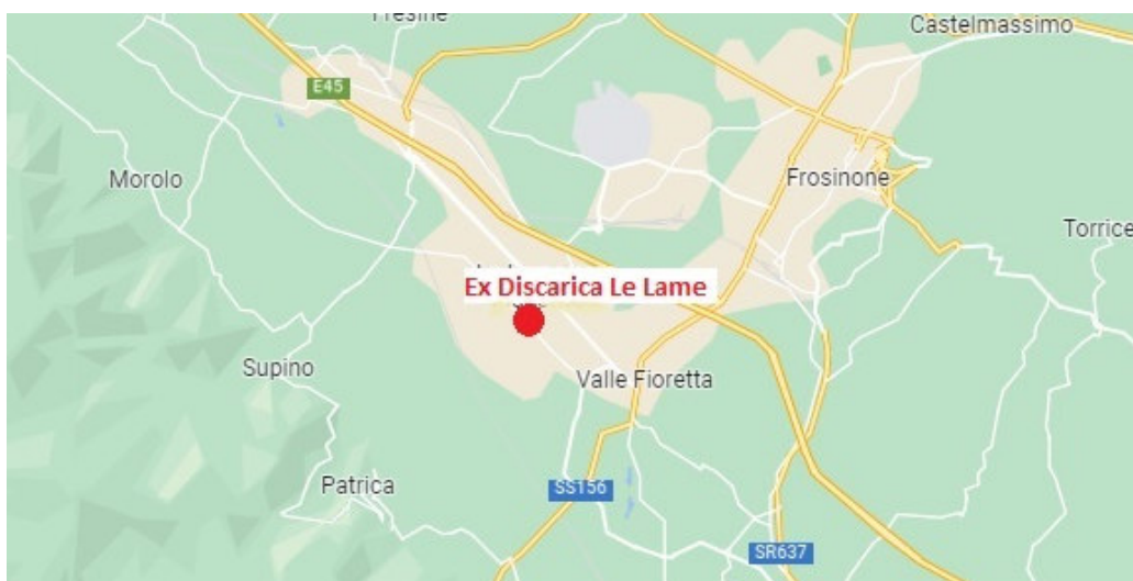
Figura I – Ubicazione territoriale del sito

Il sito, denominato nel seguito solo “Ex discarica Le Lame”, è costituito dalla discarica di RSU (attivata nel 1956 e rimasta operativa, alternando alcuni periodi di chiusura, fino al 2002) e dall'area naturale ad essa limitrofa (fascia interposta tra il corpo discarica ed il fiume Sacco).