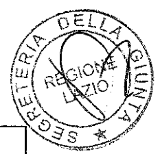
TAB. 2 – ATER DI FROSINONE