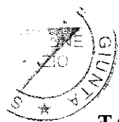
TAB. 5 – ATER DI RIETI