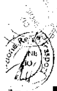
TABELLA G2 - Sira: Linea Civitavecchia - Siena