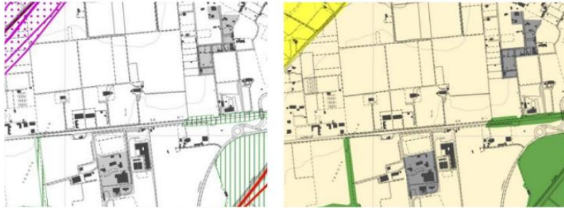
Estratto: PTPR approvato Tavole 23 -373, B e A

per l' "Uso residenziale" la "costruzione di manufatti fuori terra o interrati (art. 3 d.P.R. 380/2001 lettera e1) compresi interventi di demolizione e ricostruzione non rientranti nella lettera d) dell'art. 3 del d.P.R."