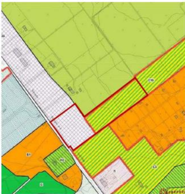
Estratto: Tavola variante del PRG vigente

L'area di intervento rispetto all'estensione della zona D3 e della zona C10 della variante generale adottata del PRG vigente, lungo la SS1 Aurelia, rappresenta, rappresenta una sua significativa anticipazione del piano stesso.