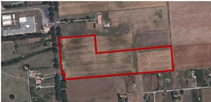
Estratto: Tavola Foto aerea con individuazione perimetro area di intervento

Il terreno su cui insiste la proposta di variante ha una morfologia pianeggiante, con quote che si attestano attorno ai 15 m s.l.m. L'area interessata dal Piano, ha una superficie complessiva di circa mq 48.444, è di proprietà della Soc. Piazza Grande S.r.L. ed è identificata al foglio catastale n. omissis con le particelle catastali n. omissis. L'intervento, in variante al PRG vigente, propone il cambio di destinazione d'uso da zona F "Agricola", sottozona F2 in parte a zona D "Aree Produttive a prevalente destinazione industriale, artigianale e commerciale", sottozona D3 "Aree di sviluppo produttivo", e in parte a Zona C sottozona "C10 Area di sviluppo urbano Olmetto Ovest" secondo la zonizzazione e la disciplina della variante al PRG vigente adottata con la D.C.C. n. 29 del 31.07.2019.