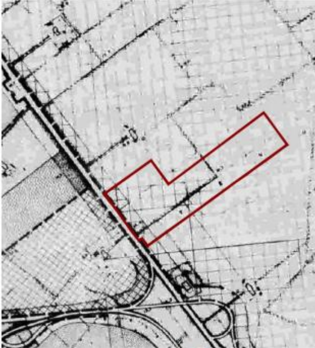
Estratto: Tavola PRG vigente

Con Deliberazione di C.C. n. 16 del 05.03.2010 è stata adottata la Variante Generale del PRG e riadottata con Deliberazione di C.C. n. 29 del 31.07.2019 avente per oggetto: "Variante generale al vigente Piano Regolatore adottata con Deliberazione di Consiglio n. 15 del 04.03.2010 e n. 16 del 05.03.2010 adeguamento al piano Piano Territoriale Paesistico e riduzione peso insediativo."