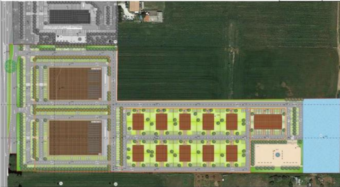
Estratto: Tavola planovolumetrico