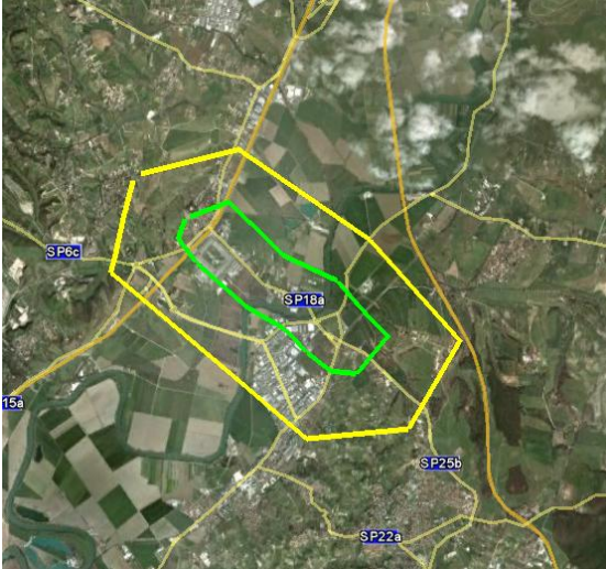
Zona focolaio Traversa del Grillo