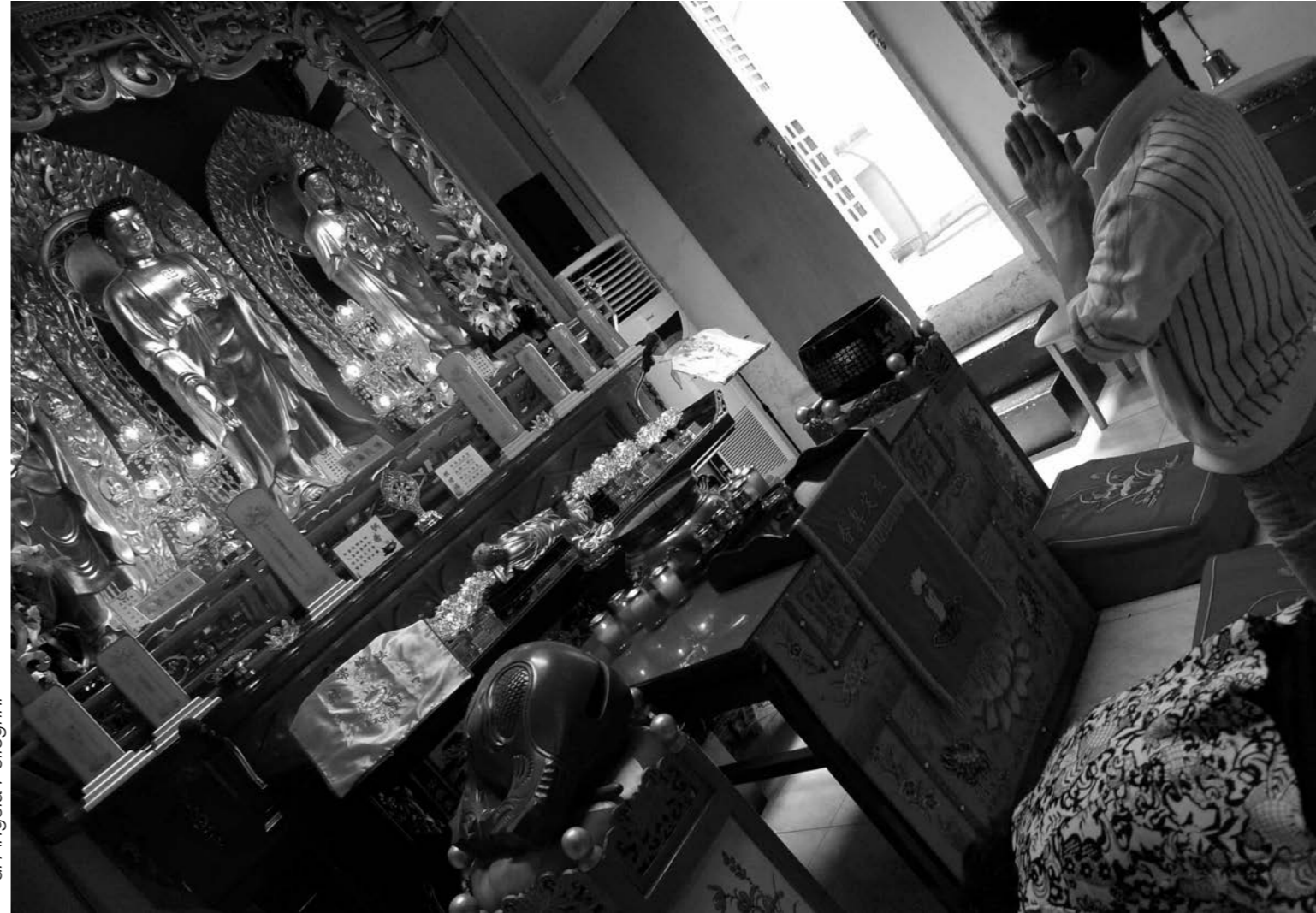
di Angela Pellegrini