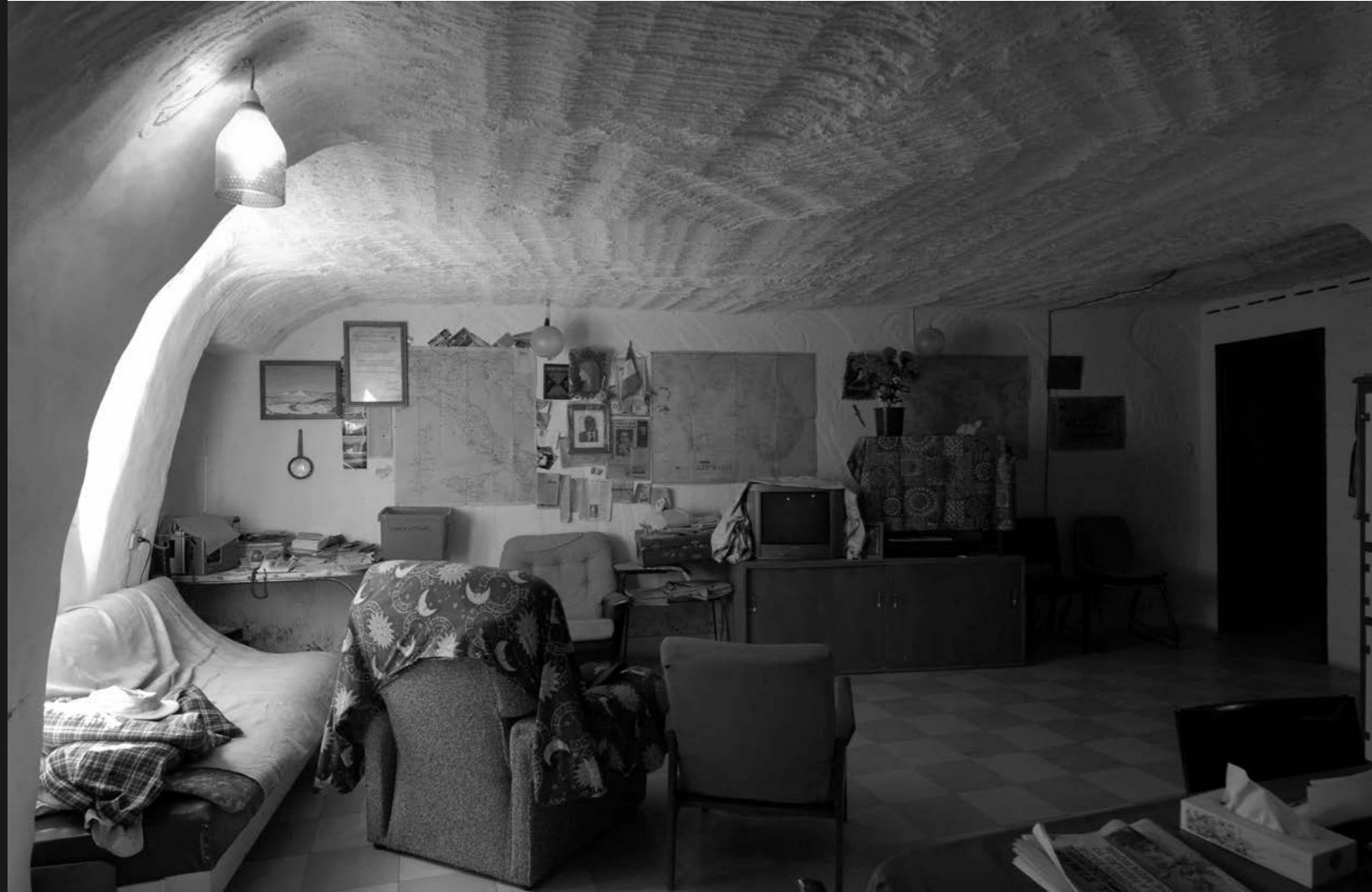
di Romina Marani