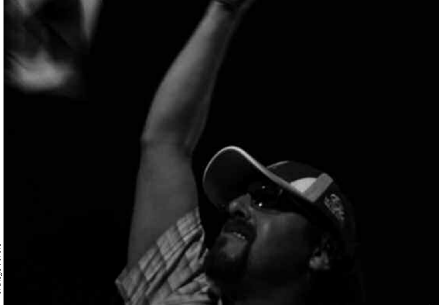
di Diego Funaro