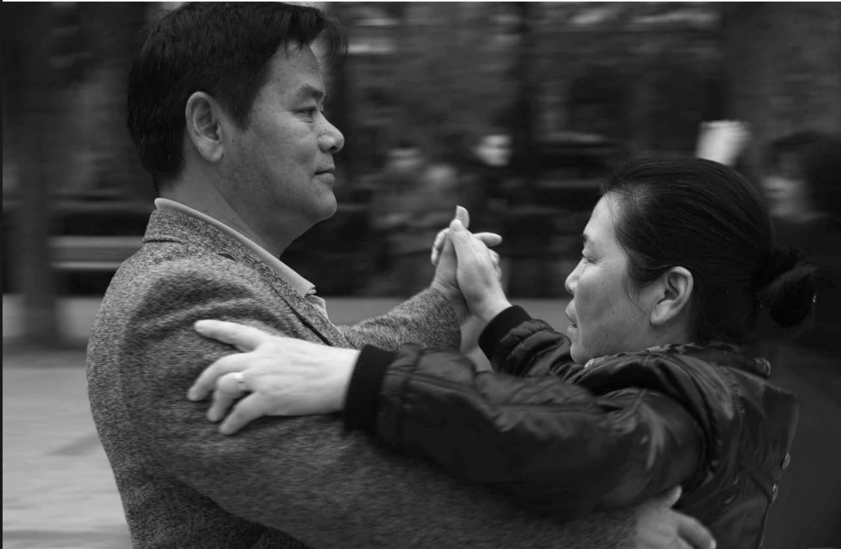
di Annalisa Polli