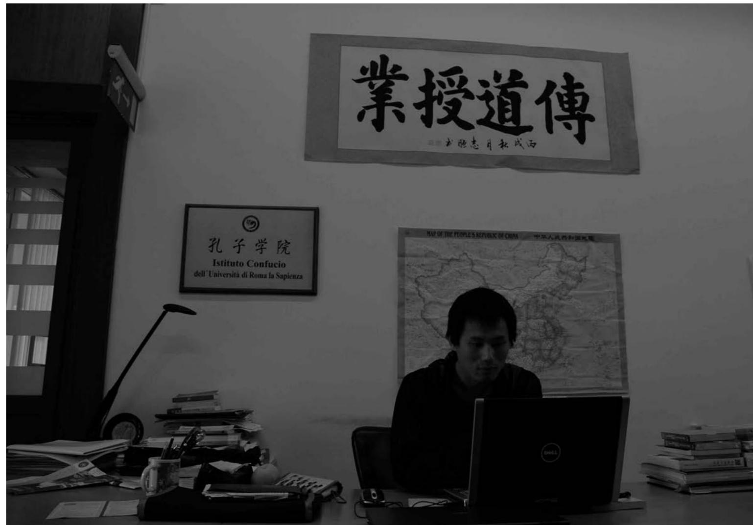
di Emanuela Iezzi