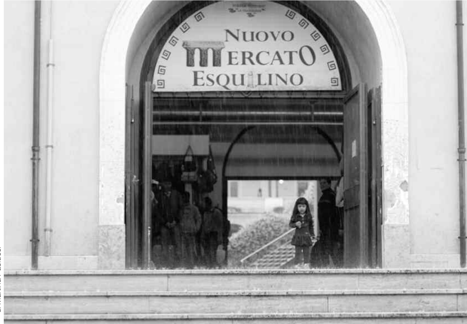
di Martina Paolucci