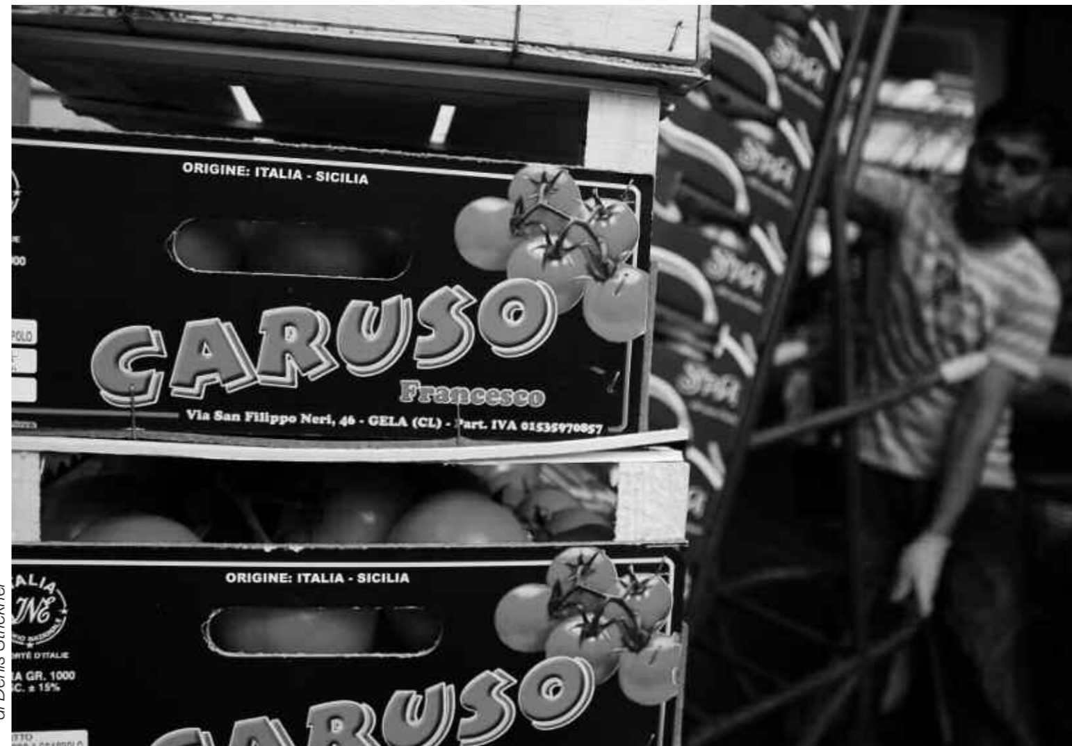
di Denis Strickner