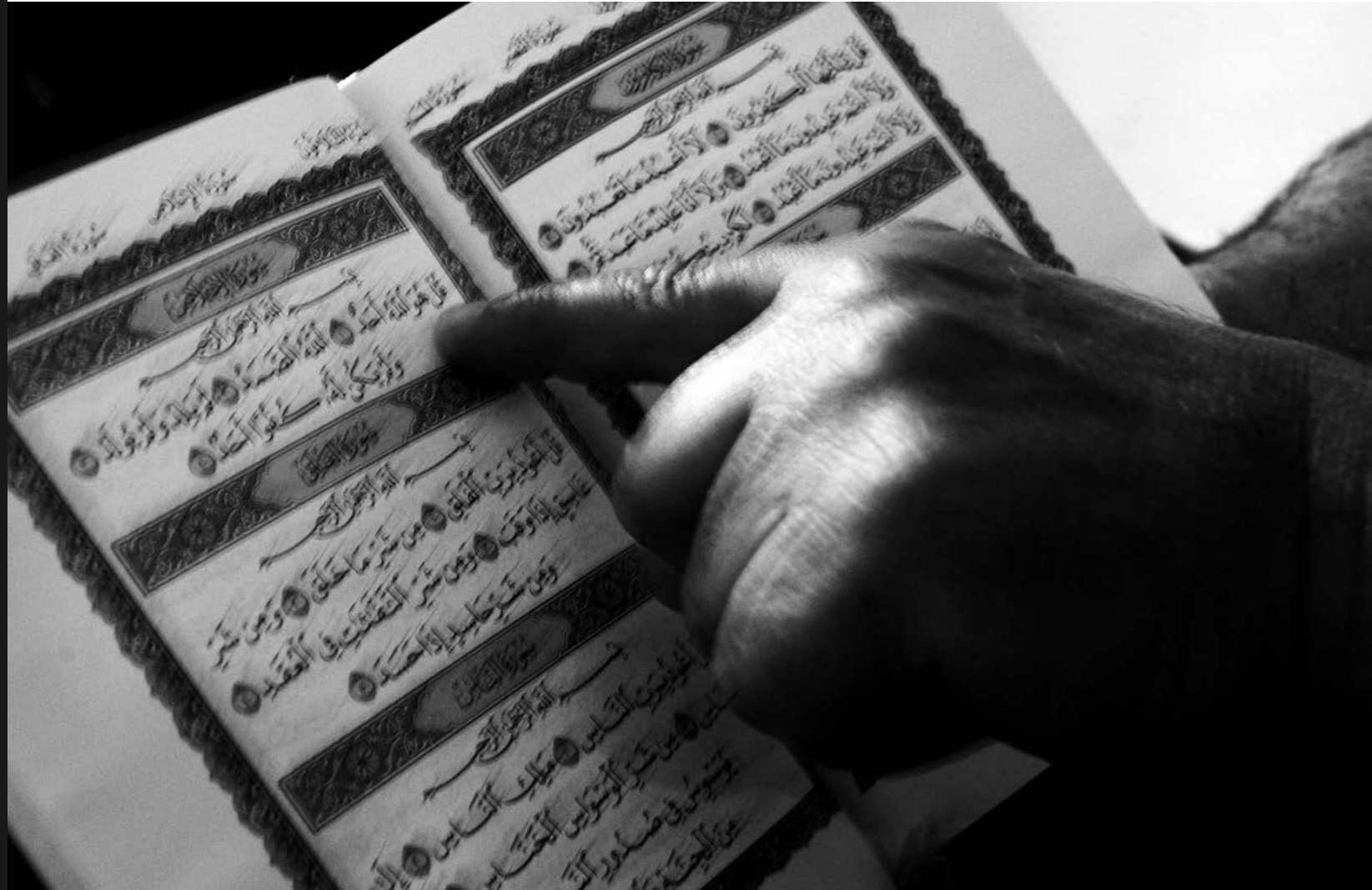
di Daniela Badali