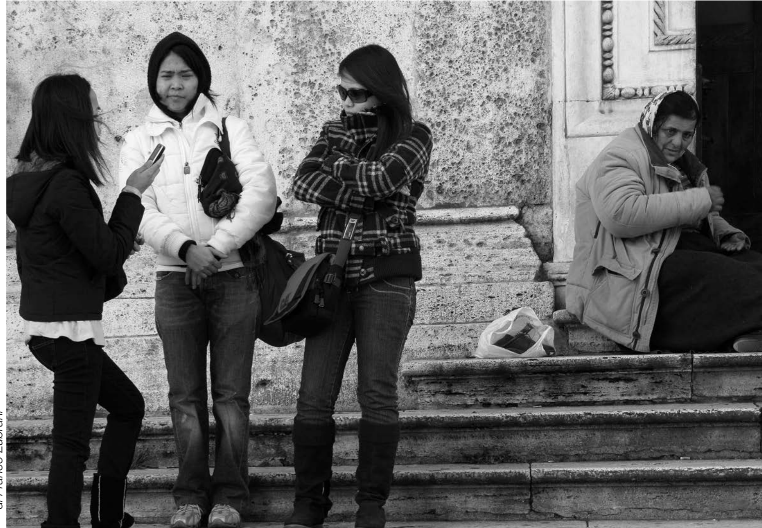
di Franco Lubrani