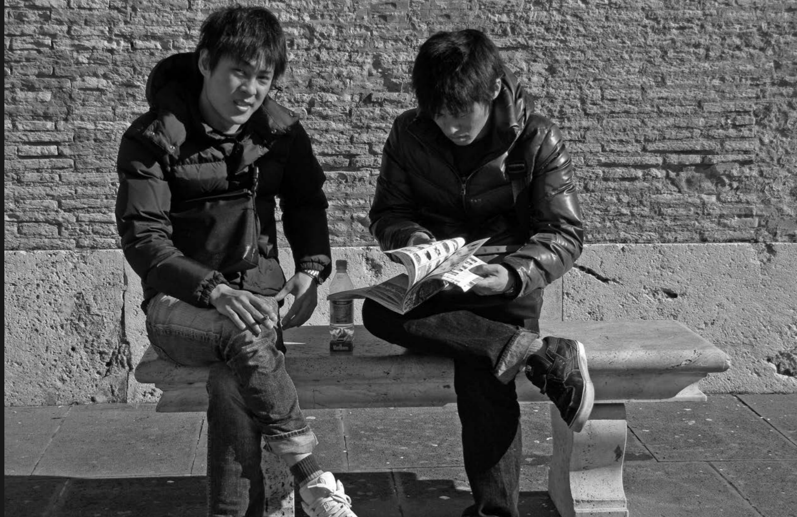
di Franco Lubrani