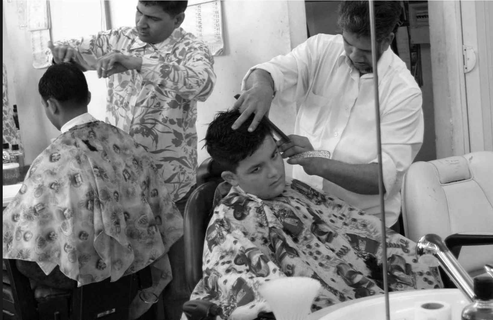
di Angela Pellegrini