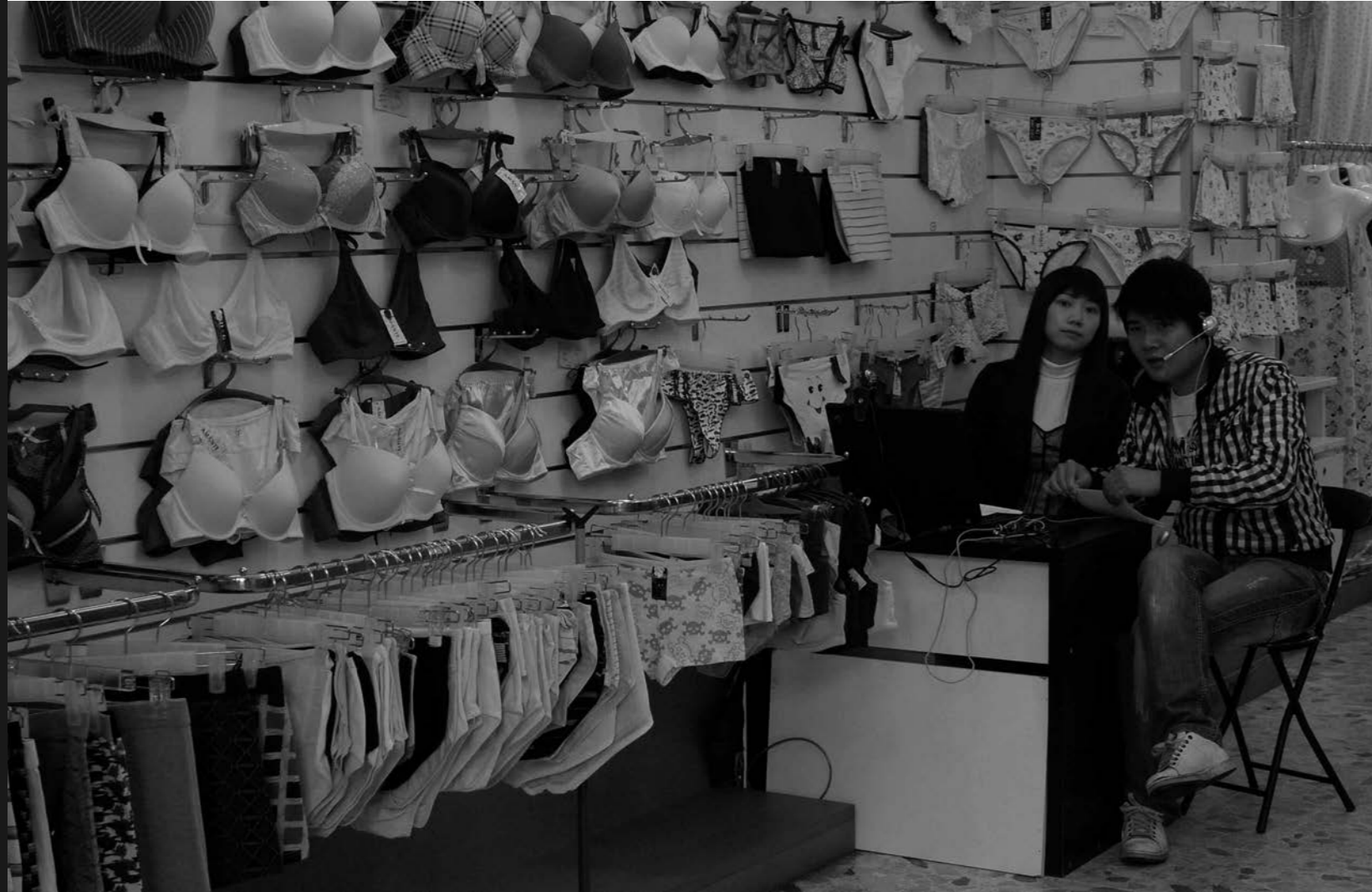
di Angela Pellegrini