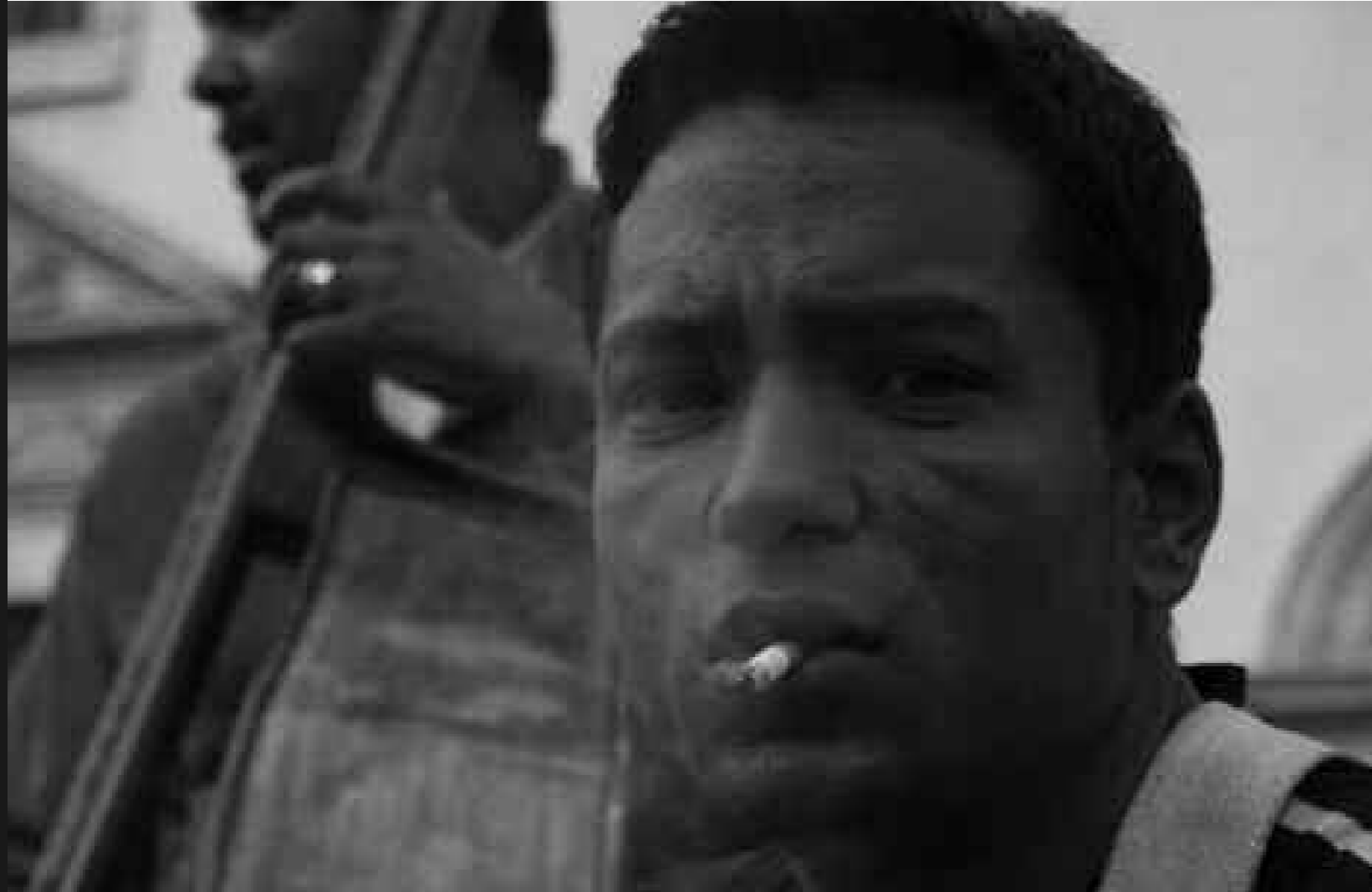
di Mario Fracasso