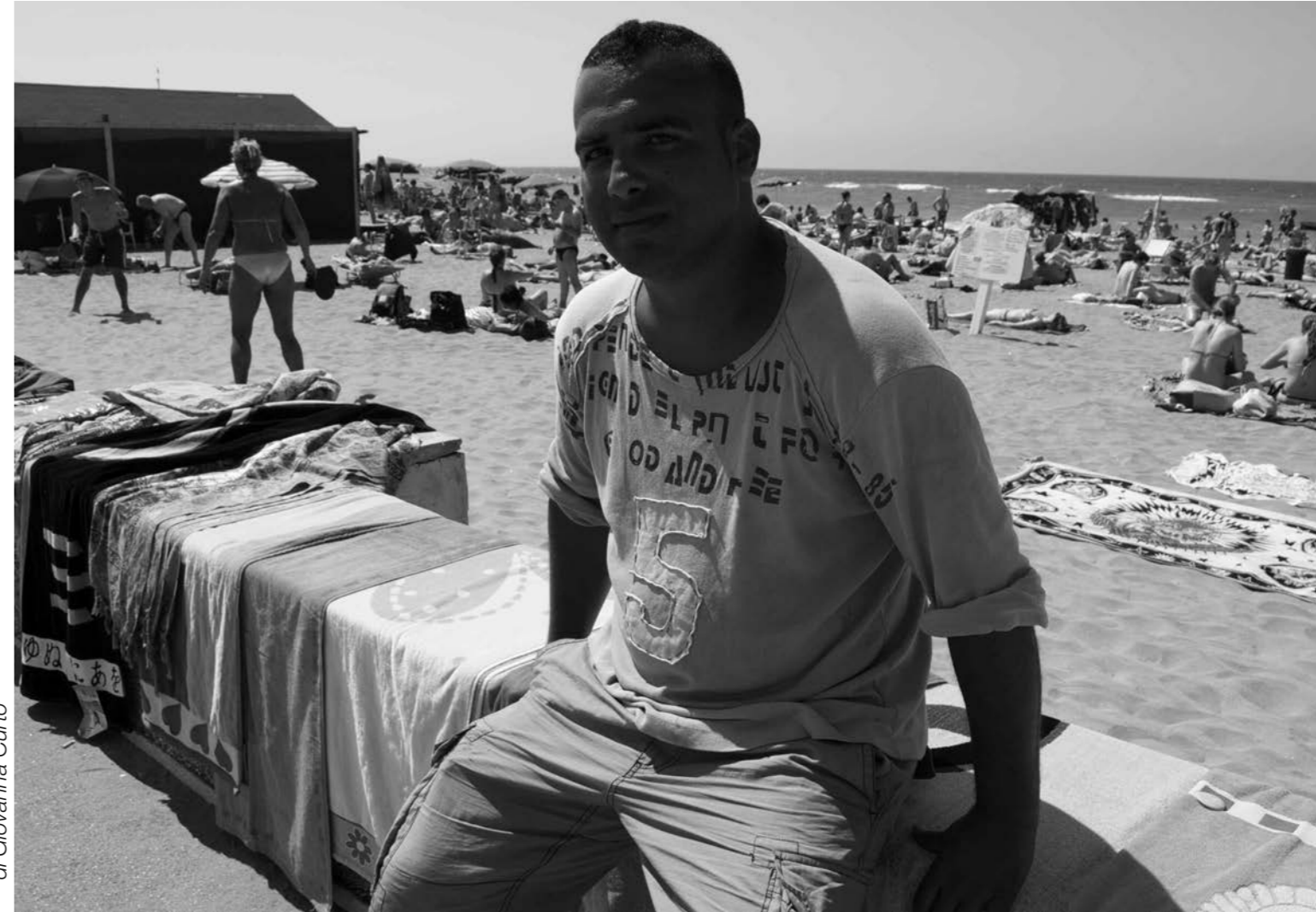
di Giovanna Curto