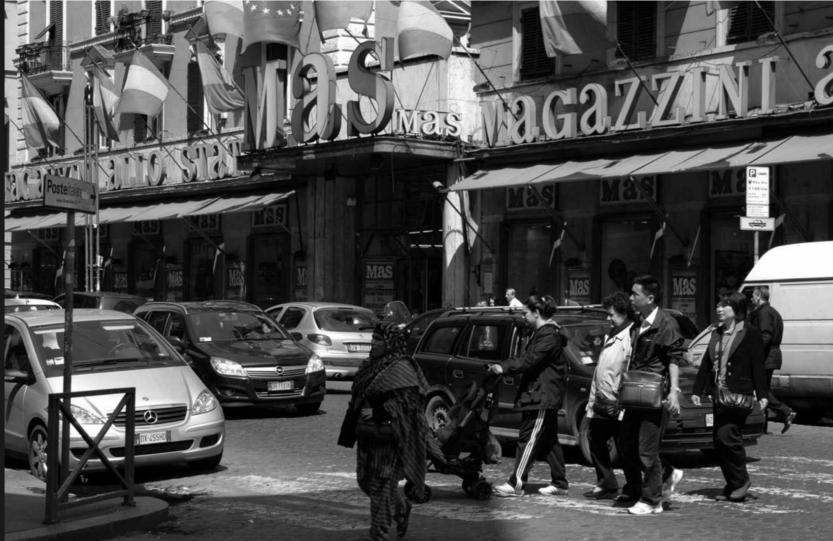
di Emanuela Iezzi