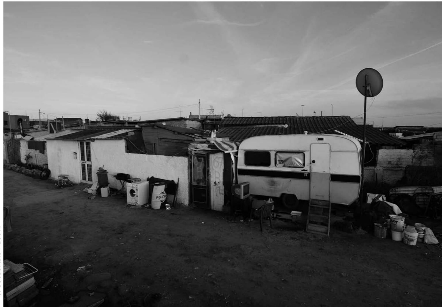
di Sebastiano Paccini