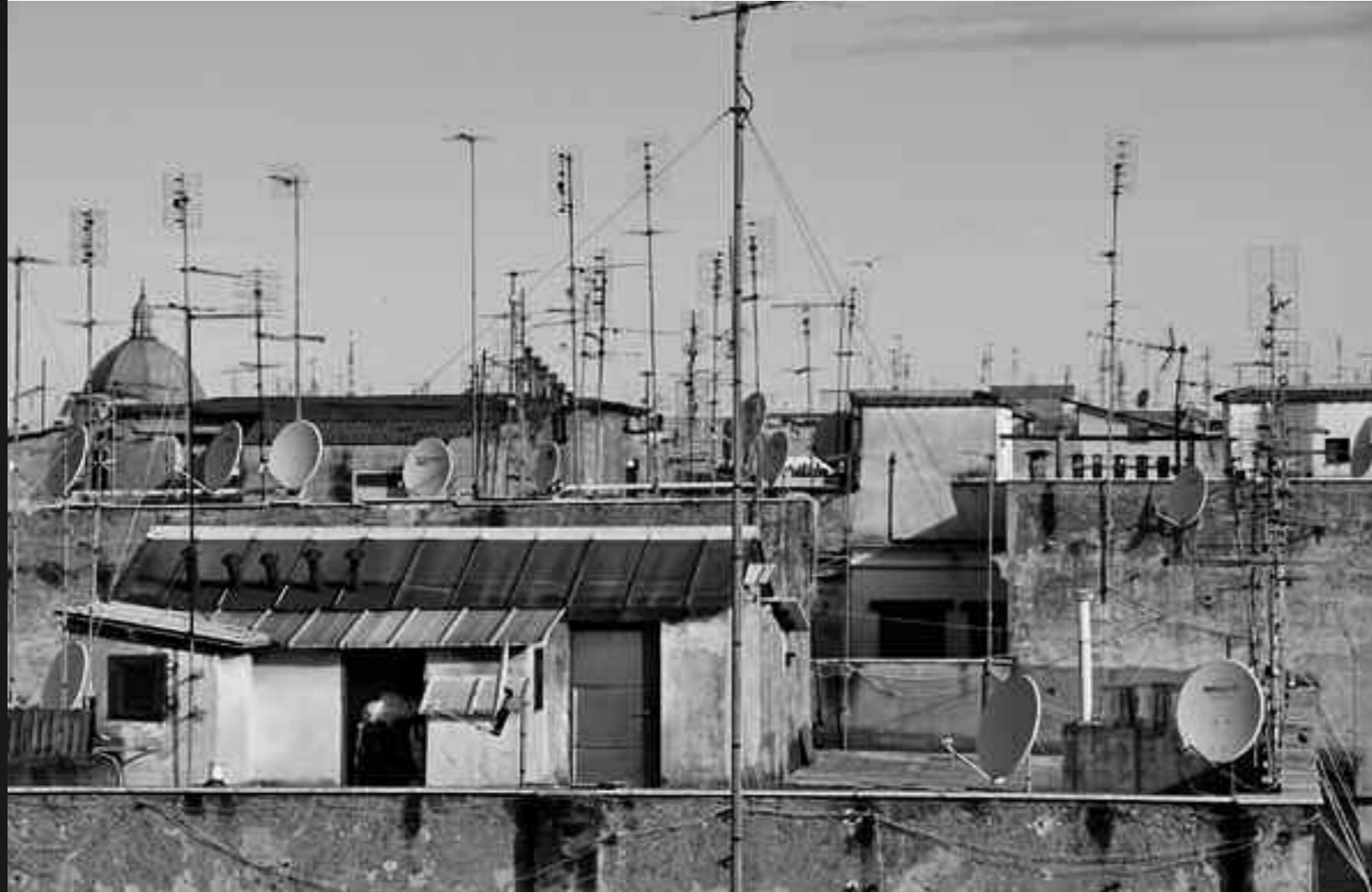
di Erica Alberti