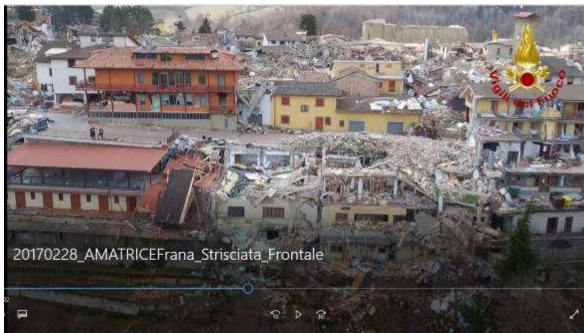
Ripresa del marzo 2017

L'oggetto della presente relazione è l'INTERVENTO DI DEMOLIZIONE TOTALE E RIMOZIONE DELLE MACERIE di quanto resta del fabbricato meglio noto come "Hotel Roma", sito in Amatrice, in Via dei Bastioni n. 29, crollato a seguito del sisma del 24.08.2016 e dei successivi sismi del 30.10.2016 e del 18.01.2017.