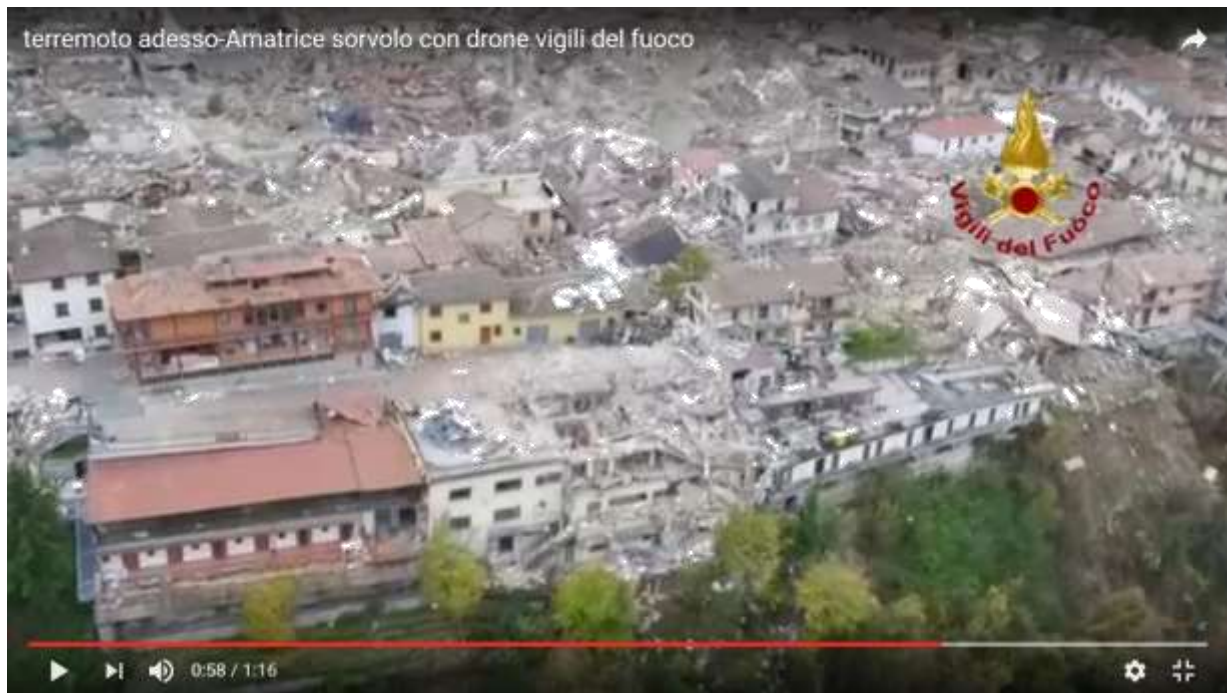
Ripresa del novembre 2016