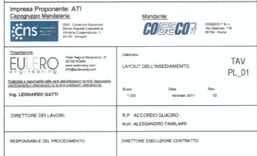
PLANIMETRIA DELL'INSEDIAMENTO - scala 1:200