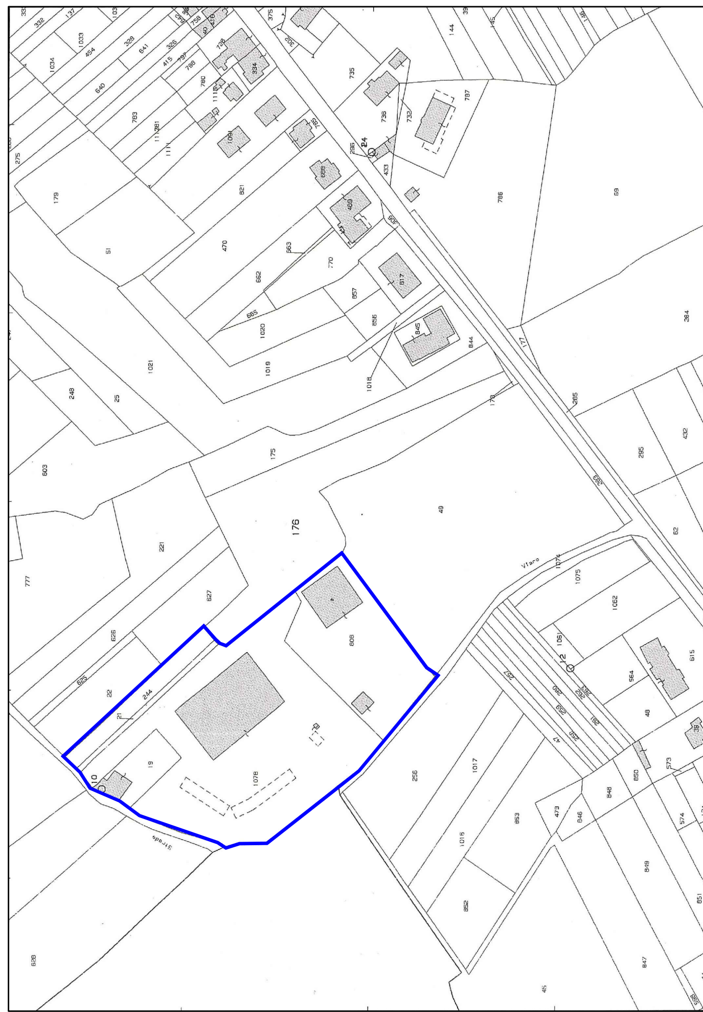
Stralcio catastale AREA ESISTENTE Fg 39 - particelle: 19,21,244,808,1078 Scala 1:2.000