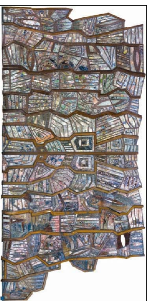
L.A. GRANDE PALETTE di FABIO TOLOMI

(ai sensi del D.Lgs. 152/06 e s.m.i. art. 29 bis e seguenti)