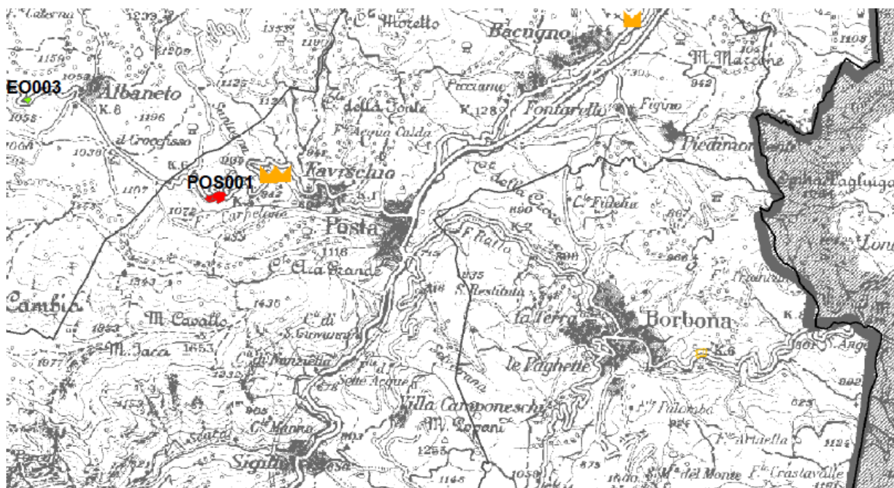
Localizzazione ex cava in comune di Posta – Loc. Carpelone

I mezzi provenienti dalla SS4 Salaria ove è posta la pesa, percorrono la strada per Terracino per circa 5 km.